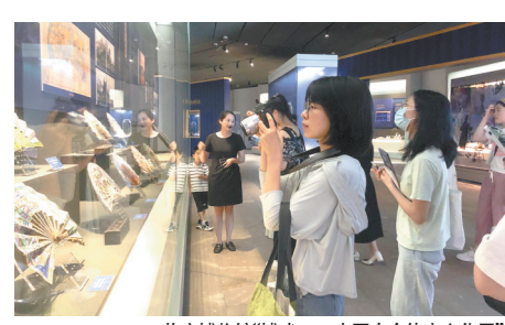
临安博物馆“博戏——中国古今体育文化展”