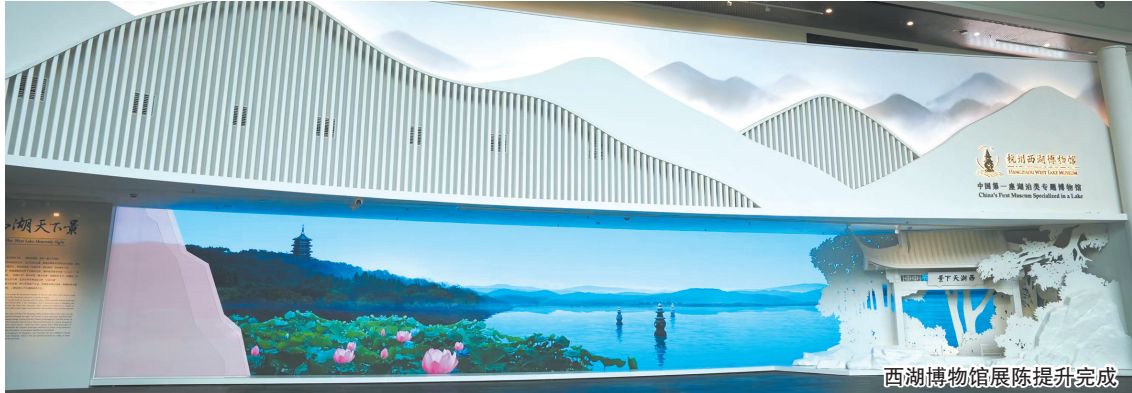
西湖博物馆展陈提升完成

博推荐官”，开展探馆、探展、探宝、探活动“四探”公共教育活动。三是一站式预约。完善杭州市197家各级各类博物馆线上预约功能，并实现电子地图导航，为市民游客提供一站式服务。通过一系列功能开发和主题推广，杭州市文博咨询在“杭城迹忆”和社交媒体上的覆盖面得到全面提升。“杭城迹忆”平台注册用户数超160万，日活用户过万，“杭城迹忆”微信公众号粉丝22000余人，小红书、微博及抖音的粉丝量近万人。