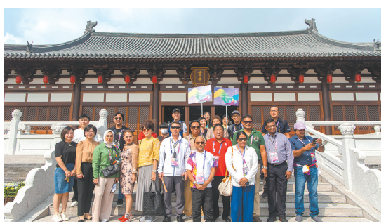
亚运宾客参观南宋德寿宫遗址博物馆