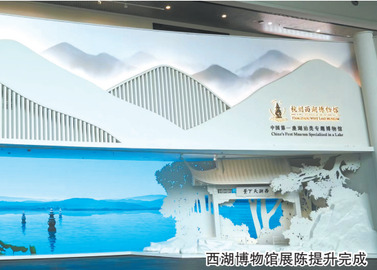
西湖博物馆展陈提升完成

题。以运动为主题，博物馆向观众呈现了“趣玩运动会·青少年教育体验展”“全民song运——南宋运动戏文化创意展”“加油!向未来——萧山运动文化展”“竞出东方——中国古代体育文化特展”等展览为亚运会赛事预热，将运动传播给更多观众。“融合无障碍 携手向未来——残障融合主题儿童青少年摄影作品巡展”“良渚童hua·儿童艺术展”等特展则向公众展示了特殊教育学校学生的创意作品、创新想象，助力亚残运会，向社会传递残疾人自强不息、超越奋进的精神。