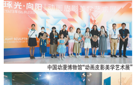
中国动漫博物馆“动画光影美术艺术展”