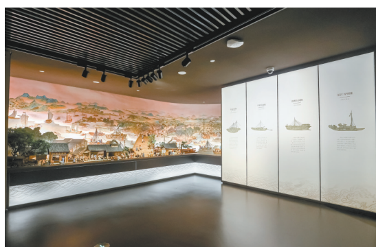
杭州京杭大运河博物馆展陈提升完成

以运动为主题，博物馆向观众呈现了“趣玩运动会·青少年教育体验展”“全民song运——南宋运动戏文化创意展”“加油!向未来——萧山运动文化展”“竞出东方——中国古代体育文化特展”等展览为亚运会赛事预热，将运动传播给更多观众。“融合无障碍 携手向未来——残障融合主题儿童青少年摄影作品巡展”“良渚童hua·儿童艺术展”等特展则向公众展示了特殊教育学校学生的创意作品、创新想象，助力亚残运会，向社会传递残疾人自强不息、超越奋进的精神。