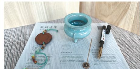
“杭城迹忆”系列香具套装