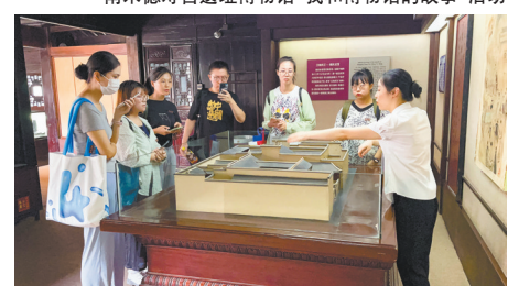
民渚博物院“礼记——中原夏商周礼乐文明展”