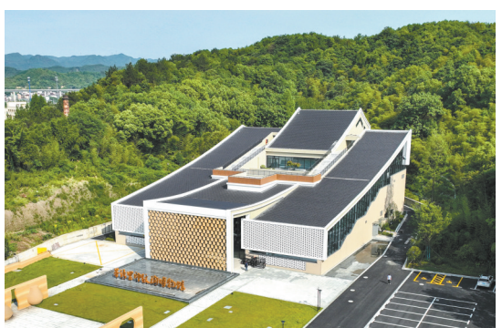
茅湾里印纹陶博物馆建筑外景

为迎接杭州第19届亚运会的召开，南宋德寿宫遗址博物馆、浙江省博物馆之江馆、茅湾里印纹陶博物馆先后建成开放，杭州博物馆、西湖博物馆、杭州京杭大运河博物馆、中国共产党杭州历史馆等场馆完成基本陈列提升，焕新迎客。亚运会期间，全市国有博物馆共推出41个亚运特展。“最国潮——文创设计大赛成果展”“与古为新：从中原到江南——中国礼制与尚古文化的源与流”“高山仰止 千古一人——苏轼主题文物展”“天堂里——工艺的苏州与杭州”等临展向世界展示了杭州市的历史、文化、艺术高峰等主