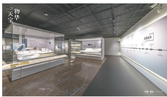
杭州博物馆“物华天宝”展厅展陈提升完成