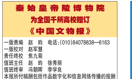
本报所付赠订包括作品数字化和信息网络传播的报酬

古重要发现、考古遗产保护与展示利用、公众考古与考古成果传播等议题进行了22场专题分享。与会代表发言结束后,中国社会科学院考古研究所研究员朱岩石作学术总结。