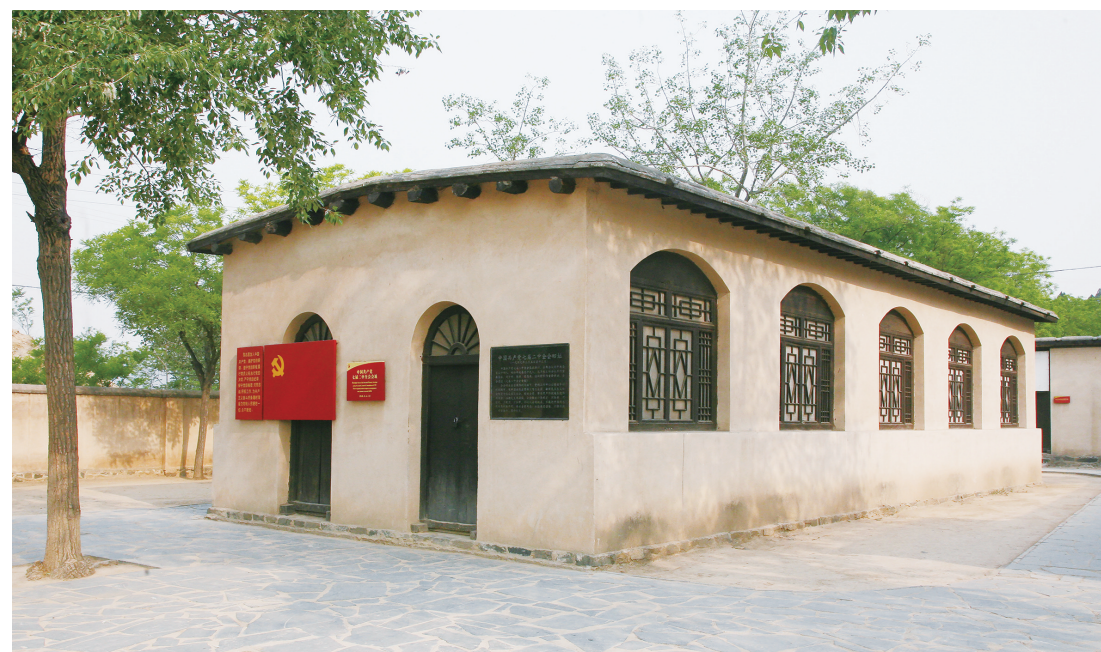
中国共产党七届二中全会旧址

手机、网络足不出户游景区，拉近文物与广大观众之间的距离。三是宣教服务创新化。在党史学习教育中，发挥革命文物独特优势，不断创新教育宣讲形式，推出参观一次主题展览、重温一次入党誓词、向伟人敬献一次花篮、听一次专题党课、唱一首红歌等特色活动，使宣教服务的深度和广度得到了拓展。