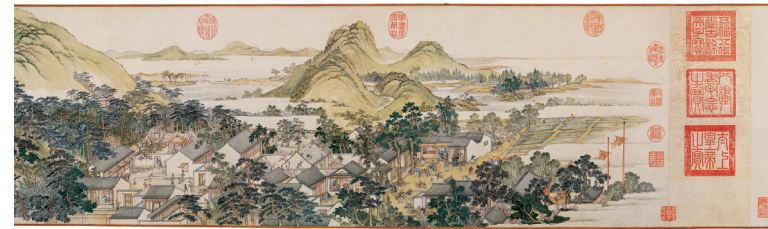
清 徐扬《姑苏繁华图卷》