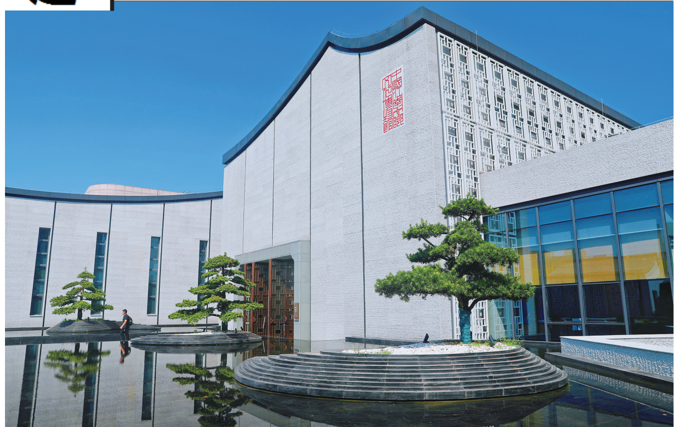
杭州市临平博物馆