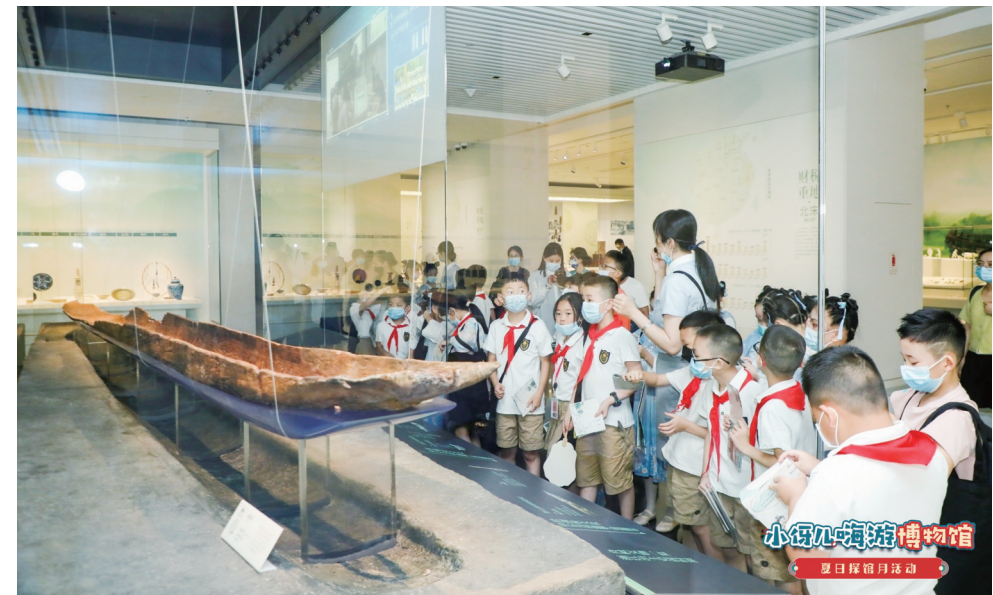
小伢儿嗨游博物馆——夏日探馆月主题活动