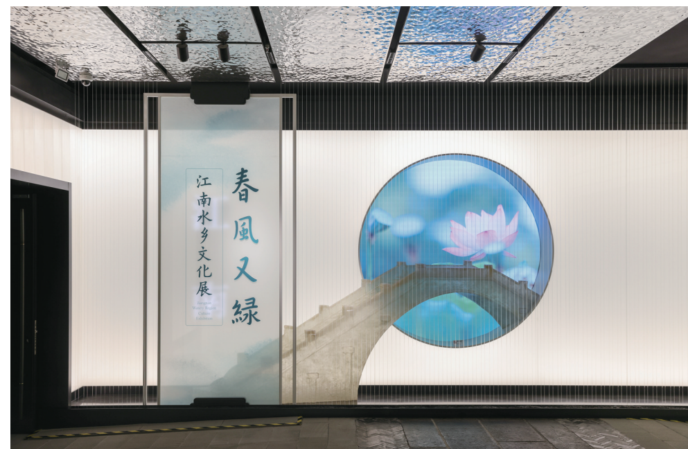
“春风又绿——江南水乡文化展”序厅

锲而不舍,开拓创新,二十年的历程在见证;根植江南,传承薪火,二十年的嬗变在讲述。在各级领导的关爱和指导下,在各界友人的帮助和激励下,临平博物馆弱冠初成,秀于江南,在文博事业蓬勃发展的今天,也正蓄势以乘风,抱才将致远。守护地域文化根脉,提升文物保护利用水平,拓展公共文化服务事业。未来,临平博物馆将以专业的匠心、传承文明的使命和铸就文化新辉煌的情怀,不负时代,继续前行。