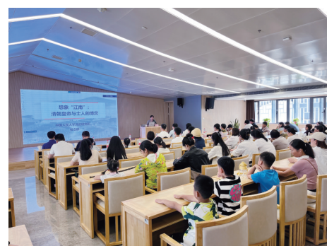
江南水乡文化大讲堂系列——《想象“江南”》