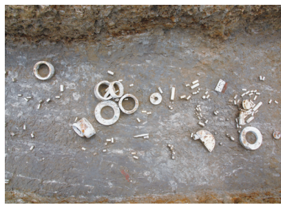
玉架山遗址考古现场出土玉器