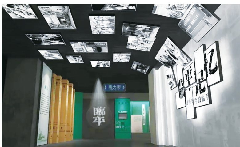
“临平记忆——口述史里的临平”展