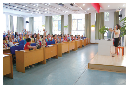
让历史告诉我们——社教活动进校园