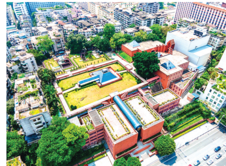
南越王博物院王墓展区