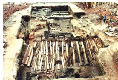
南越国木构水闸遗址