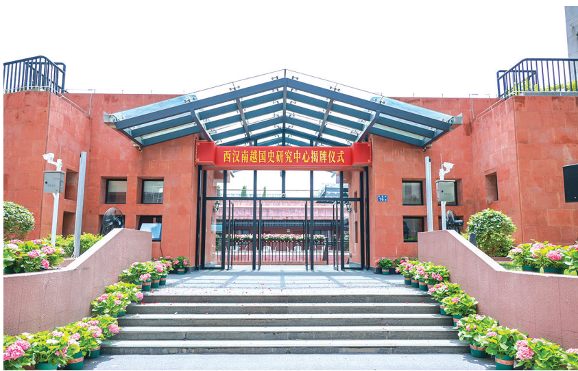
西汉南越国史研究中心揭牌

此外,设于王墓展区的西汉南越国史研究中心于今年6月9日正式揭牌。该研究中心总建筑面积3315平方米,内设藏品保护综合实验室、图书资料库房与阅览室、教育体验空间、学术报告厅等功能空间。南越国时期的考古遗址和出土文物为公众进一步了解优秀传统文化提供重要的渠道,与之相关的主题研究有待更深入的探索,西汉南越国史研究中心为此提供了重要的硬件支撑,助力中华优秀传统文化的创造性转化和创新性发展。