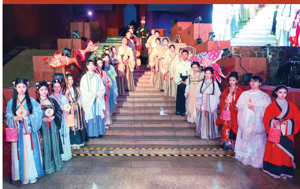
王墓展区举办的大型活动“梦回南越”

2023年是广州考古70周年和南越文王墓发现发掘40周年,为纪念这一重要时刻,12月25日,南越王博物院特别策划和举办了“探索·实践——南越文王墓发现40周年特展”,该展以“惊世发现”“万年永宝”“推陈出新”和“薪火相传”四大主题集中展示南越国遗迹发现、保护、利用的发展历程,展示先进的保护理念与宝贵经验。展览将持续至2024年2月25日。