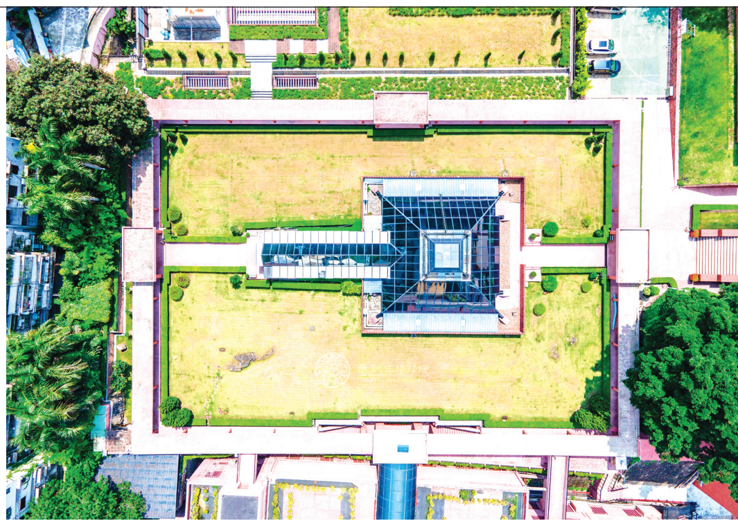
南越文王墓俯瞰图