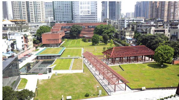
南越王博物院王宫展区