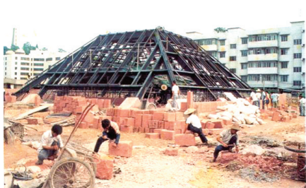
南越文王墓原址上正在建造保护棚