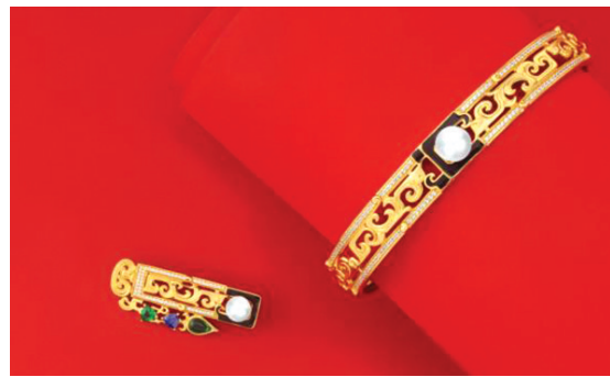
荣获2022—2023年度广东博物馆十大文创精品称号的“有风来仪”

“对历史最好的继承,就是创造新的历史;对人类文明最大的礼敬,就是创造人类文明新形态。”1983年至2023年,南越文王墓发现已有40载,希望以“探索·实践——南越文王墓发现40周年特展”为契机,展示南越国遗迹发现、保护、利用的发展历程,展示先进的保护理念与宝贵经验,展示几代考古人及文博工作者锐意进取、奋楫笃行,致力于守护与传承文化遗产的精神,努力建设具有中国特色、中国风格、中国气派的考古学和博物馆。