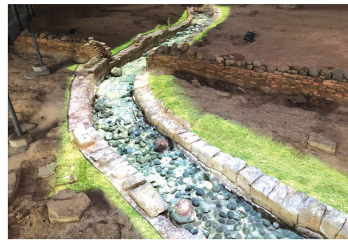
王宫展区曲流石渠数字化展示