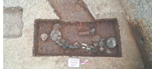
图七 崧泽文化时期墓葬M221

鼎足和类似于钱山漾文化的大鱼鳍形鼎足。商周时期可分为3个亚层,土色以灰白色为主。这一时期也有少量房址和墓葬。灰坑较大,对早期遗存造成较大的破坏。房址由经过处理的多层铺垫土建造,有的仍以石块作为房屋基础,此类房址未发现柱洞,推测已构筑了土墙;也有柱洞环绕的半穴式的房址。墓葬规格较前期为大,墓坑较深,但随葬品较少,可见岳石文化风格的夹砂红陶罐和西周时期的原始瓷豆等。文化层中可见大量遗物,硬陶所占比例非常高,也有少量的原始瓷器和来自于宁镇—皖南地区的鬲、鼎、豆、甗等。