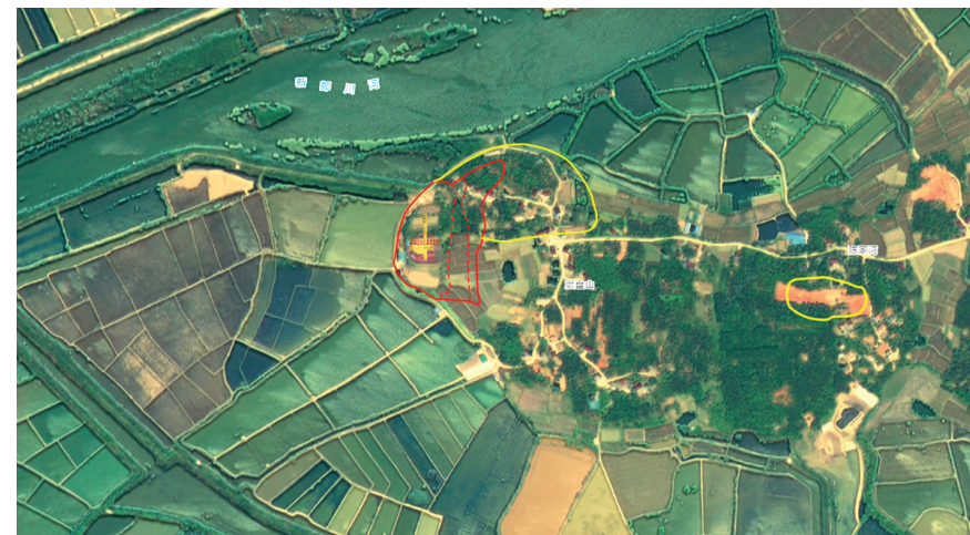
图三 磨盘山遗址分布范围及布方位置