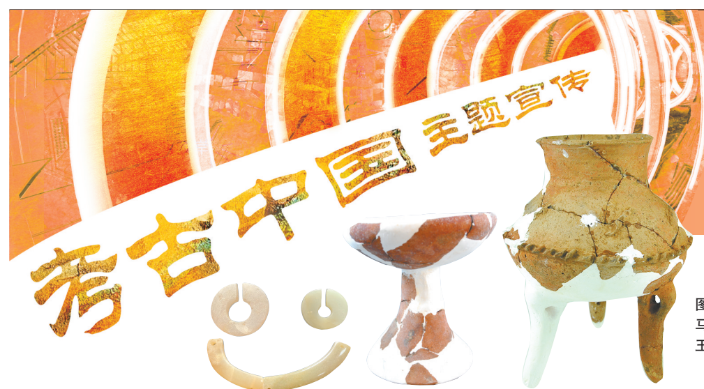
图八 马家浜文化时期 玉器、陶器