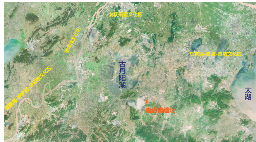
图一 磨盘山遗址位置及环境

该遗址于20世纪70年代因开掘新法川河而发现。1981年6月,当地兴修水利时又出土了大量遗物。1985年郎溪县第二次全国文物普查将其纳入不可移动文物名录。2003年安徽省文物考古研究所对其进行了调查。2008年第三次全国文物普查时又进行了复查,确定为一处新石器时代—商周时期的遗址。2012年6月安徽省人民政府将其公布为省级文物保护单位。2015和2016年南京大学联合安徽省文物考古研究所进行了两次发掘。2020年该遗址被列为国家社科基金重大招标项目“长江下游社会复杂化及中原化进程研究”的核心依托遗址,2022年被国家文物局列入“考古中国——长江下游区域文明模式研究”课题,并于2023年进行了第三次发掘。同年,“安徽郎溪磨盘山遗址考古发掘资料整理与研究”获国家社科基金重点项目立项。