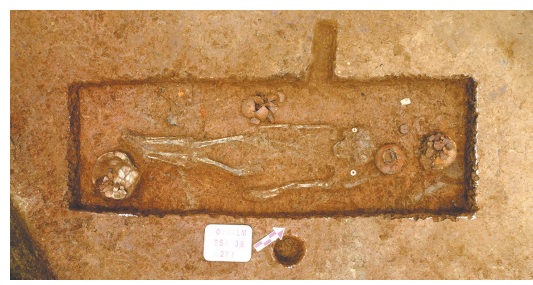
图五 马家浜文化晚期墓葬M271

良渚至钱山漾文化时期可分为4个亚层,土色以黄灰色为主。这一时期有少量房址和墓葬,房址挖基槽,基槽内可见柱洞,墓葬规格较小,可见双鼻壶、翅形和横断面呈“T”形鼎足的陶鼎等,文化层中可见较多的类似于良渚文化末期的足尖外撇的三角形