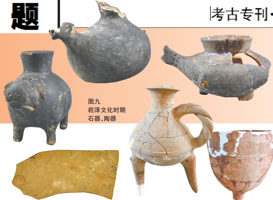
图九 崧泽文化时期 石器、陶器