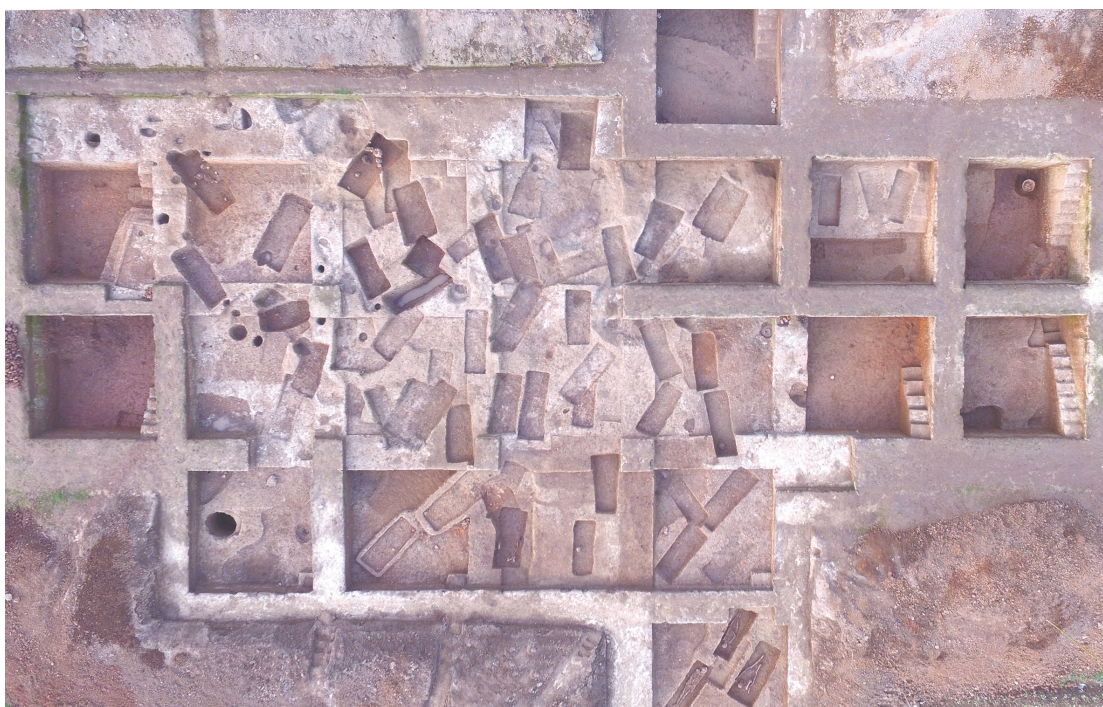
图六 崧泽文化时期墓葬区