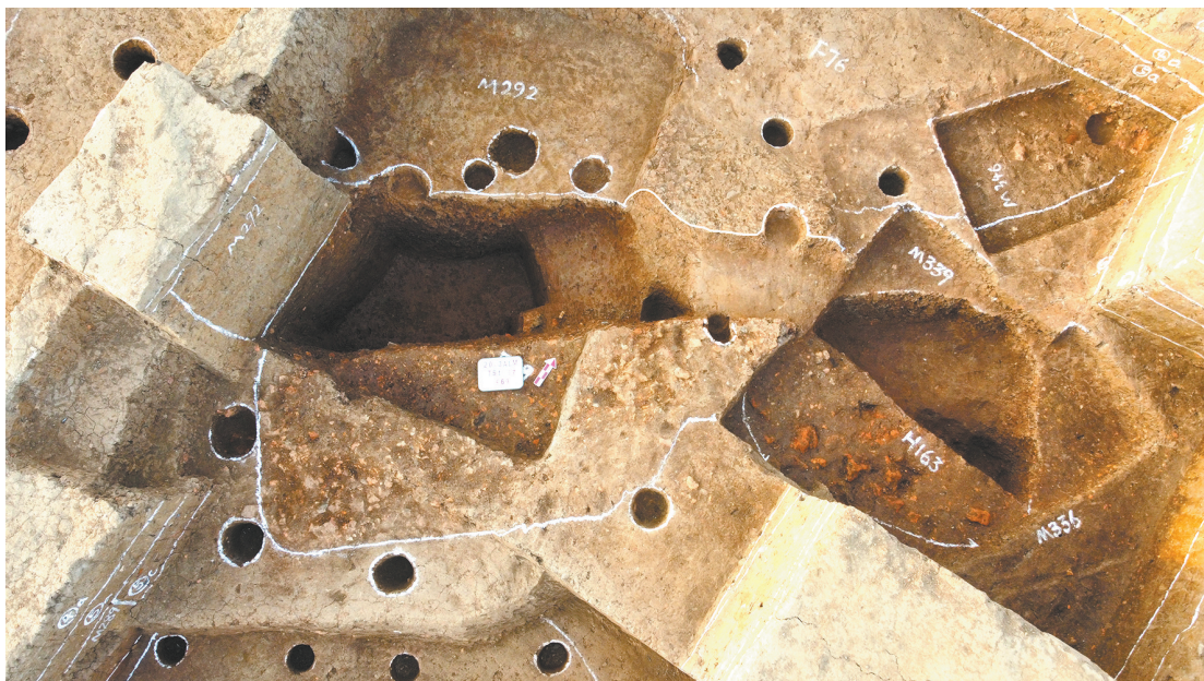
图四 马家浜文化时期房址F69