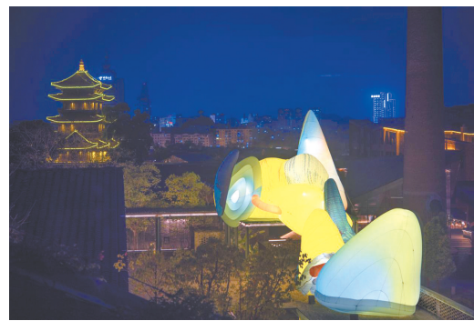
上: 历史街区内设置分展区展示当代艺术装置 中: 展览第二章 微观瓷演 展厅场景 下: “青花秘境”小程序主页面