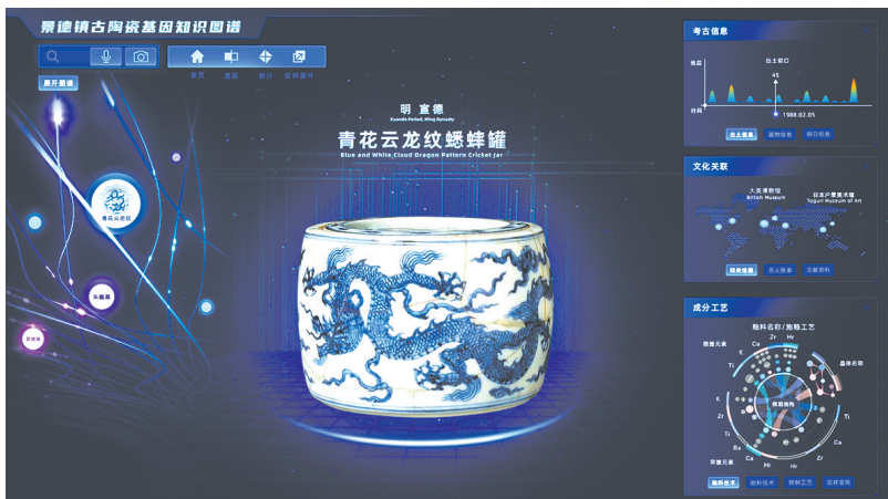
景德镇古陶瓷基因库知识图谱

景德镇御窑博物院始创于1989年,是集御窑考古、文保和展示为一体的综合性文博机构,前身为景德镇市陶瓷考古研究所和景德镇官窑博物馆。30多年的建院(所)历史和得天独厚的陶瓷考古资源和研究成果,使其在国内外陶瓷考古和文博界享有较高的声誉。2021年景德镇御窑博物院(新馆)在御窑遗址公园内建成并对外开放,实现了御窑大遗址的展陈、考古、文保、社区有机融合。