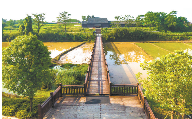
刘贺墓园北门保护性设施