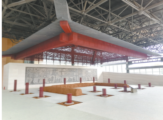
刘贺墓园主墓祭祀建筑保护展示