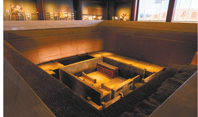
刘贺墓园主墓复原展示