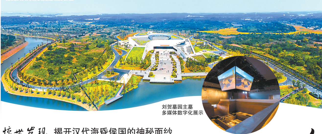
刘贺墓园主墓多媒体数字化展示