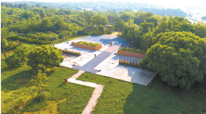
刘贺墓园东门、园墙、门阙保护展示

保护是为了更好地利用,为了让文物更好地活起来。江西省委省政府、南昌市委市政府高度重视海昏侯国遗址公园建设。南昌市政府专门成立了南昌汉代海昏侯国遗址公园建设领导小组,分步推进公园项目落地实施。2017年6月,管理局组织完成了《南昌汉代海昏侯国国家考古遗址公园建设项目可行性研究报告》,由东南大学齐康院士领衔担纲,完成了遗址博物馆、游客中心等项目建筑设计。2017年12月,海昏侯国遗址公园被列入第三批国家考古遗址公园立项名单。遗址公园建设按照“精心规划、精致建设、精细管理、精美呈现”要求,以大投入落实大保护,以大建设带动大发展,投入38亿余元,全面完成“一馆(遗址博物馆)、一心(游客中心及配套设施)、一园(刘贺墓园保护展示一期)、一道(紫金大道及延长线)”等遗址公园一期项目建设。遗址博物馆建设用地面积约11.88公顷,总建筑面积约39330平方米,地下1层,地面2层,局部3层(含夹层),建筑物高度18米,综合容纳展示陈列、文化交流、文物库藏、研究保护、考古研究基地、管理服务、后勤设备七大功能板块,工程荣获2020-2021年度国家优质工程奖。游客中心建设用地面积约7.67公顷,总建筑面积9903平方米,建筑主体面积7920平方米,层数2层,综合容纳咨询售票、候车换乘、休憩茶饮、展示宣传、观演会议、VIP休息、管理用房、设备用房等八大功能板块。