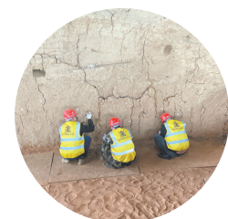
刘贺墓园主墓外藏椁车马坑裂隙修补注浆