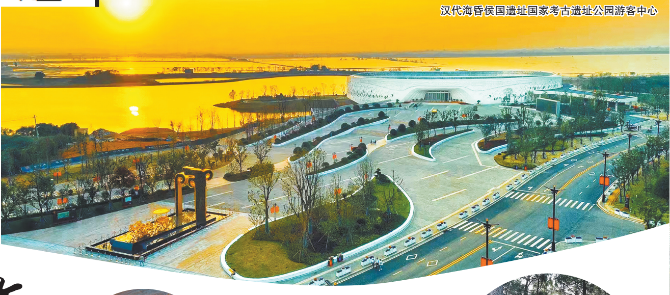
汉代海昏侯国遗址国家考古遗址公园游客中心